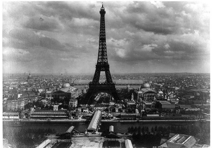
La Tour Eiffel nel 1889

Due anni, due mesi e cinque giorni: tanti ne bastarono per la costruzione di quello che sarebbe diventato uno dei monumenti più celebri e copiati al mondo. La Torre Eiffel, la più famosa costruzione di tutta la Francia, fu inaugurata a Parigi il 31 marzo 1889 e aperta ufficialmente il 6 maggio dello stesso anno, per l'avvio dell'Esposizione Universale del 1889 (nel centenario della Rivoluzione Francese).